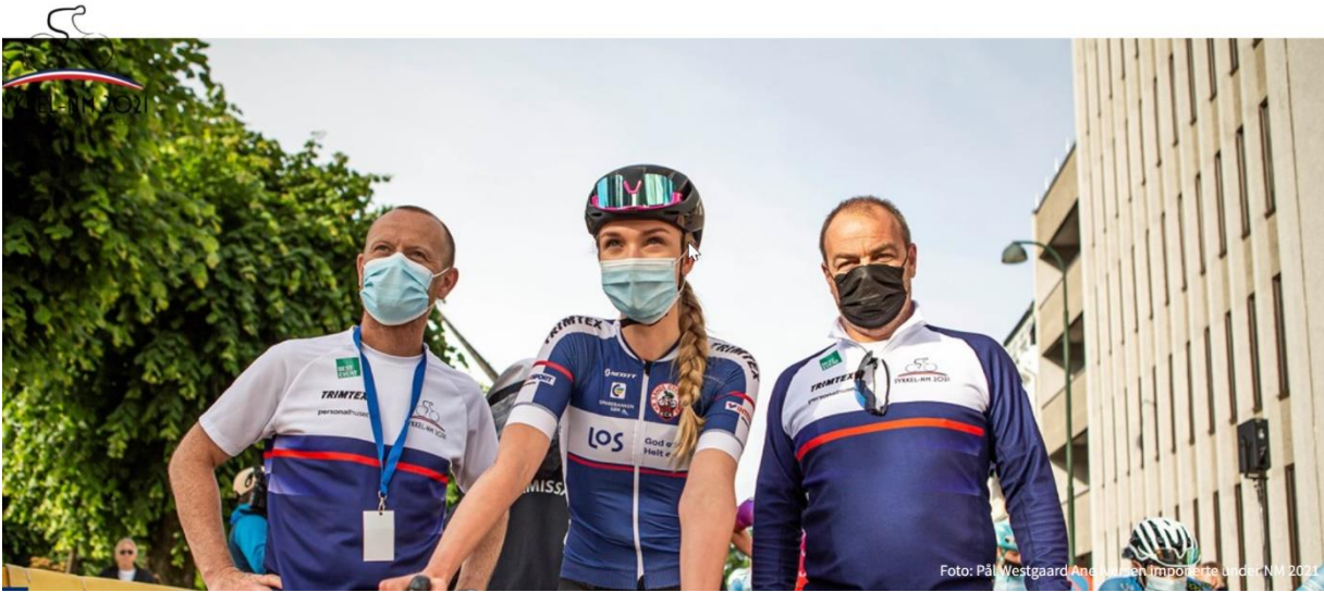
Anehusen Importerte Utdr. NM 2021